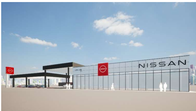
日産サティオ 高岡店 設計:完了 / 施工:2022 年 11 月完成予定