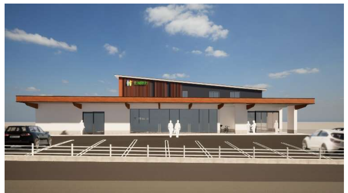
北國銀行 かほく支店 設計:完了 / 施工:2023 年 3 月完成予定